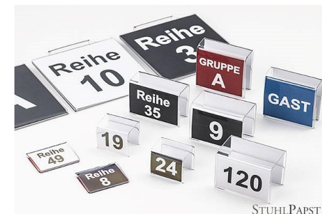
Reihennummerierung Klemme Klein